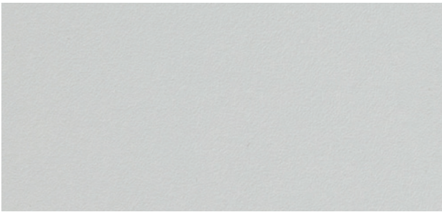
MEGR Kronospan licht grijs - U191 PE