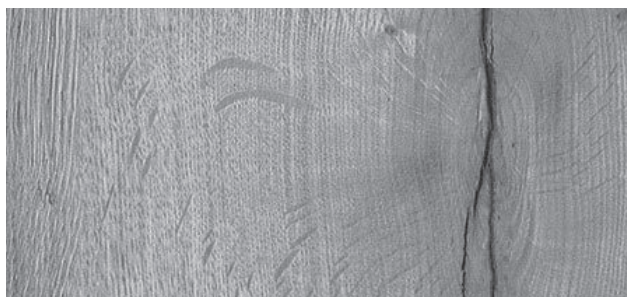
Detailed view (approx. 27 x 18 cm)