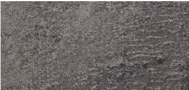
ML02 (≈HP02) Egger Beton Dunkel - F275 (ST9)