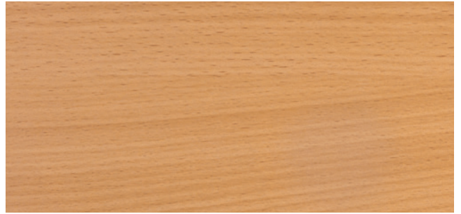
MLHE Unilin Jura - 747 (CST)