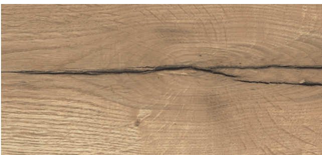
MH84 (≈HA84) Egger H1180 Halifax Eiche natur