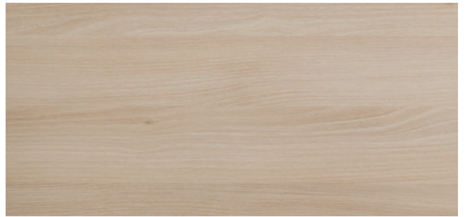
ML91 (≈HP91) Egger Lakeland Akazie Hell - H1277 (ST9)