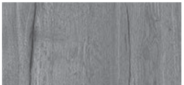
Close up view (approx. 60 x 37 cm)