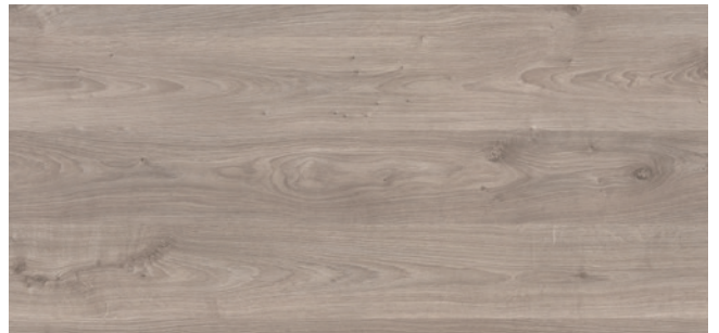
ML77 (≈HP77) Unilin Minnesota Oak greige H160