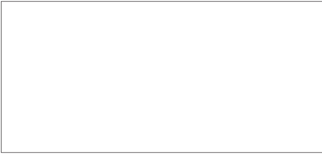
ML90 Unilin Polar wit - WA12 (CST)